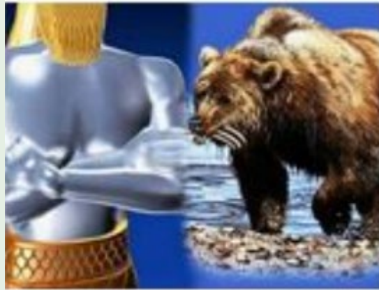
メディア・ペルシア