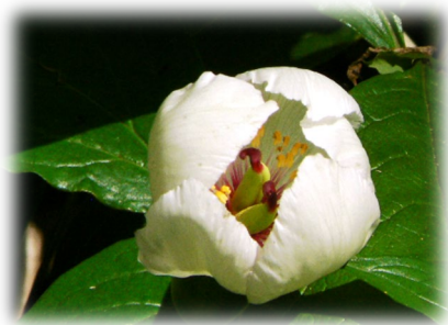
石山に咲く「ヤマシャクヤク」