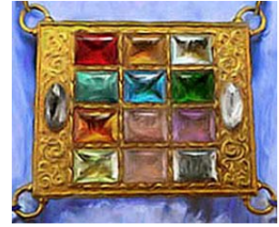
(上図は大祭司のエポデ)

●都の土台石は 12 の宝石で飾られています。東にある第一の土台石は「碧玉」、第二は「サファイア」、第三は「めのう」、北の第四の土台石は「エメラルド」、第五は「赤緞めのう」、第六は「赤めのう」とありますが、名前は同じであっても、色はしばしば異なることがあるようです。幕屋で仕えた大祭司の胸あて(エポデ)には 12 の宝石がはめ込まれています。出エジプト記 28 章 17～21 節には以下のように記されています。