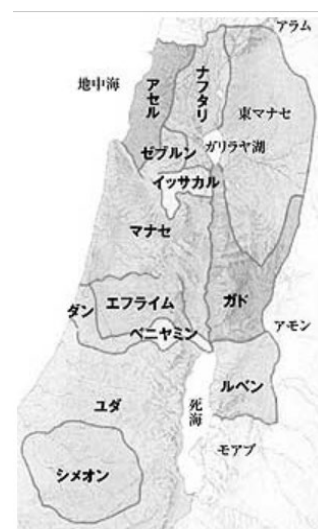
イスラエル12部族に分割された土地

●Ⅱ歴代誌 15章では、アサの治世の第15年の第三の月に、彼はユダとベニヤミンのみならず、エフライム、マナセ、シメオンから来て身を寄せている人々をもエルサレムに集めて、契約を結びました。まさに宗教改革です。