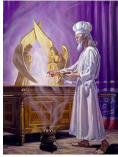
〔大贖罪日に香炉を携えて至聖所での務め〕